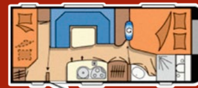
Grundriss: Mietwohnwagen 1